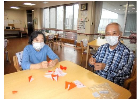
千羽鶴づくりに協力してくれた皆さん