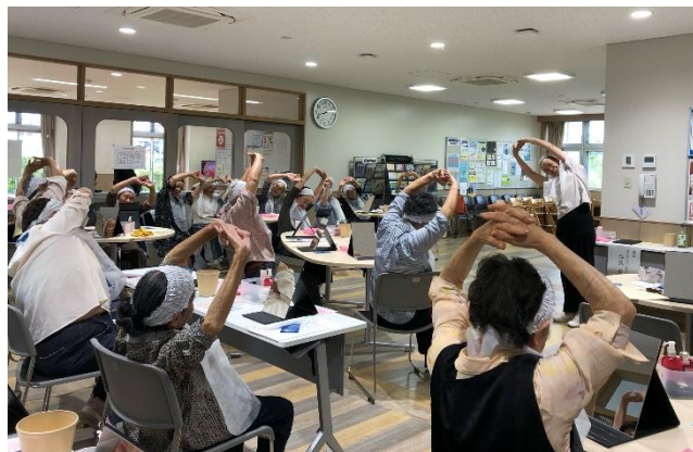
👉 お化粧前にみんなでストレッチ！