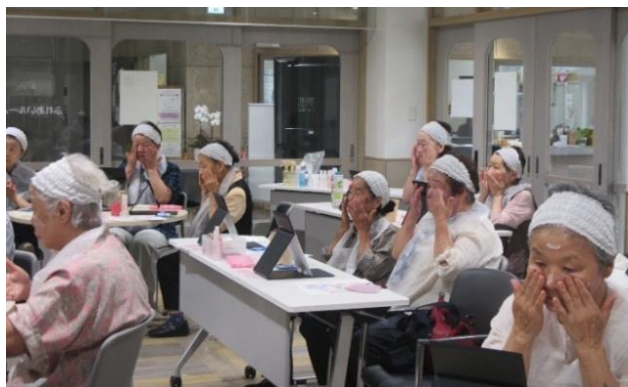
👉 鏡を見ながら顔のマッサージ！真剣な様子