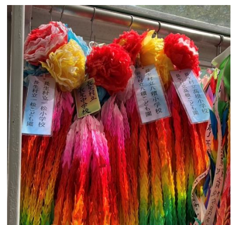
👉 八積小6年生と糸通し作業。みんな上手でした！