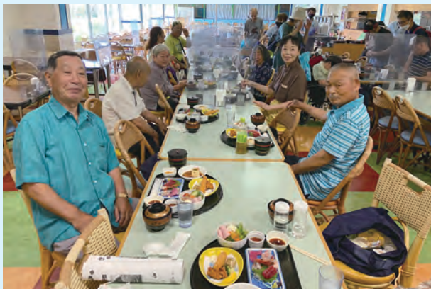
仲間と楽しくお昼ご飯