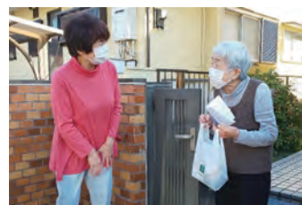
【高齢者見守り訪問】

令和4年度の千葉県の助成総額約5億7千万円のうち、約4億2千万円は市町村の身近な福祉のために助成し、約1億5千万円は県域の福祉のために助成しました。