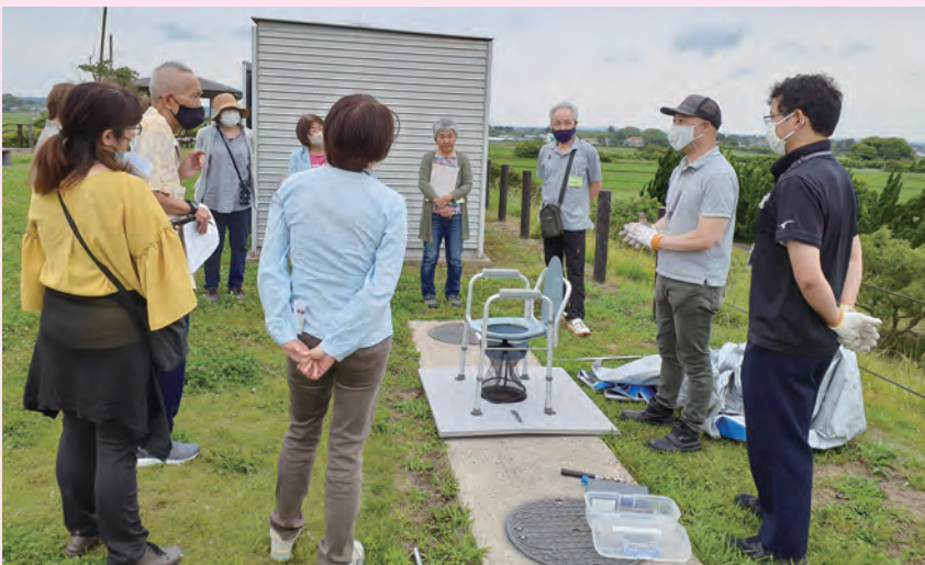
一松地区MURA座談会では、城之内築山公園の防災設備を見学しました