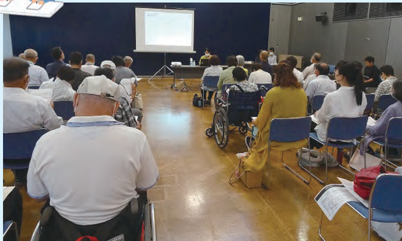
説明に聞き入る役員たち

村福祉会では、スポーツやレクリエーション等を通じて障がい者同士が助け合い、相互理解を深め、障がい者福祉の向上と社会参加の促進を図っています。 今年度も日帰り研修、芸能発表会やスポーツ大会等様々な行事を計画しております。 「交流の場を広げたい」「身体を動かしたい」「旅行に行きたいけれど…」などお思いの方、まずはお気軽にご連絡ください。