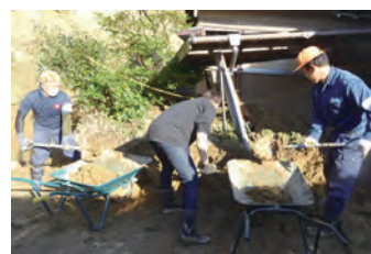
【令和元年度房総半島台風 復興支援の様子】

令和元年度房総半島台風でも災害ボランティアセンターの設置や、被災地で復旧・復興活動を行うボランティア団体の支援のために県内25市町村で3,659万円が活用されました。