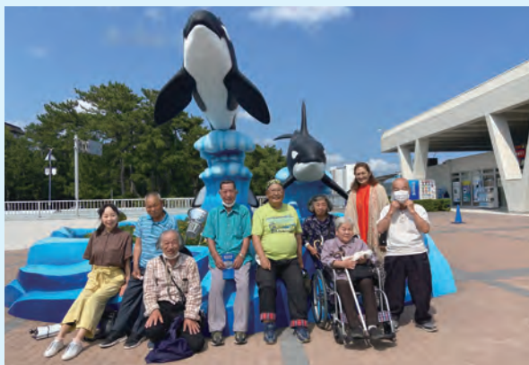
みんなで記念の集合写真