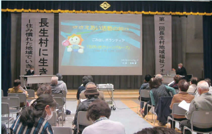
ごみ出しボランティアの活動紹介の様子

今回のフォーラムでは、住民と行政が協働しながら、地域でつな がりをつくっていくことの大切さを学びました。