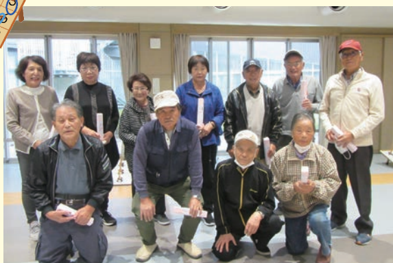
長生村悠悠クラブ輪投げ大会にて

長生村悠悠クラブ(長生村老人クラブ連合会)は、村内にある各地域単位の7つのクラブが集まってできています。概ね60歳以上の方であればどなたでも入会できます。芸能大会、研修旅行、グラウンドゴルフ、ペタンク、輪投げ、ポッチャ、作品展など活発な活動をしています。あなたも会員になって仲間との交流を深め、一緒に活動しませんか。