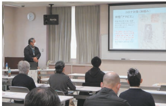
講師の説明を熱心に聞き入る参加者

令和5年2月19日(日) 保健センターにて、日赤奉仕団、自主防災会、社会福祉協議会役員など30名弱の参加により、長生村災害ボランティア講習会を開催しました。