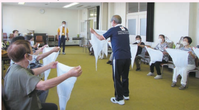
一日赤十字の様子

9月6日(火)、一日赤十字を福祉センターにて開催しました。内容は、災害時に一人でできる三角巾手当法。日本赤十字社千葉県支部より救急法指導員2名を招き、膝・足首・腕などケガや出血した際に三角巾で固定する方法を学びました。参加した奉仕団員は教わった結び方を、解いては結び、畳むという一連の作業を何度も試していました。また、三角巾がなければ、スカーフ、シート、ストッキングで代用して出来ることも実践しながら指導してくれました。